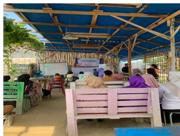
Gambar 4. Kegiatan sosialisasi Pengabdian Masyarakat Kelurahan Terjun

Karena sosialisasi dan diskusi dilakukan secara langsung, terbukti efektif dalam meningkatkan keterlibatan peserta. Banyak peserta menyampaikan pertanyaan dan berbagi pengalaman pribadi mereka, yang kemudian digunakan sebagai studi kasus dalam diskusi kelompok [16]. Untuk akhir kegiatan dilakukan evaluasi yang dapat dilihat pada grafik 1.