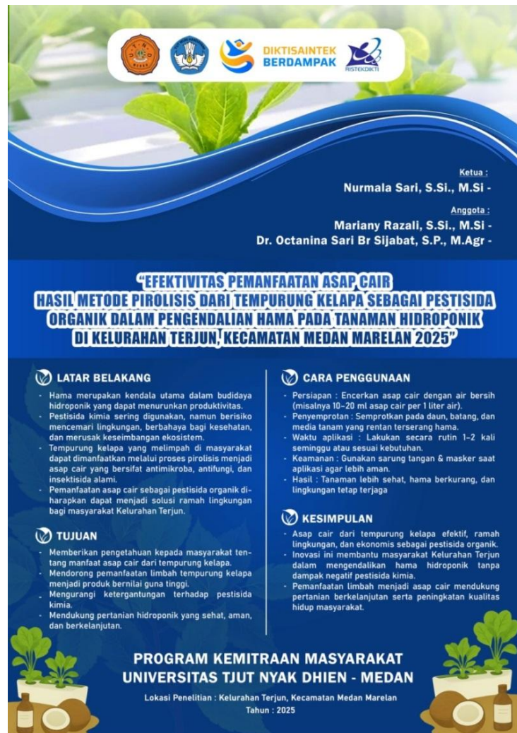
Gambar 2. Leaflet berisi informasi asap cair

Distribusi leaflet terbukti membantu peserta memahami konsep yang disampaikan secara visual dan praktis[14]. Penggunaan media cetak sederhana seperti leaflet merupakan sarana efektif dalam kegiatan penyuluhan pertanian karena dapat dibaca ulang setelah kegiatan selesai[15].