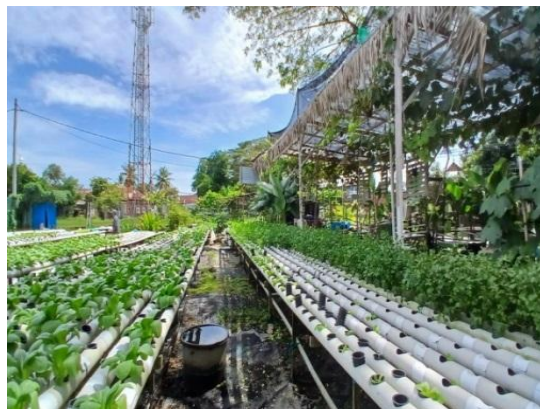
Gambar 1. Tanaman hidroponik dikelurahan terjun Medan Marelan

Perkembangan teknologi dibidang pertanian terus bertambah cepat setiap tahunnya. Salah satu teknologi yang patut diperkenalkan ke masyarakat adalah teknologi hidroponik[1]. Terdapat beberapa masyarakat kecamatan Medan Marelan yang terdiri dari berbagai profesi yaitu sebagian besar bekerja disektor industri, petani, nelayan, pegawai maupun wiraswasta[2]. Salah satu masyarakat di Kelurahan Terjun ada yang mengembangkan teknologi dalam bidang pertanian yaitu teknologi hidroponik.