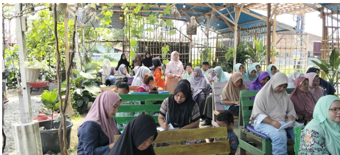
Gambar 3. Peserta mengisi pertanyaan kuisisioner awal dan akhir (Pretest –Postest)